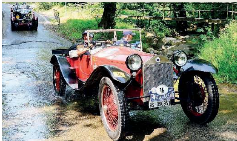
Passaggio spettacolare. Un momento di una passata edizione

D omenica 31 maggio Brescia si accenderà di motori e adrenalina con il «Trofeo Valli Bresciane - Memorial Cirillo Gnutti», la gara che celebra la passione per le auto storiche lungo strade spettacolari. Mancano pochissimi giorni alla chiusura delle iscrizioni, fissata a mercoledì prossimo, 27 maggio, per partecipare all'undicesima edizione organizzata dalla Scuderia Emmebi70 di Lumezzane. Anche quest'anno la gara mantiene la titolazione nazionale Acì Sport per il Trofeo Nazionale di Regolarità, confermando l'elevato livello organizzativo e l'ospitalità riservata agli equipaggi.